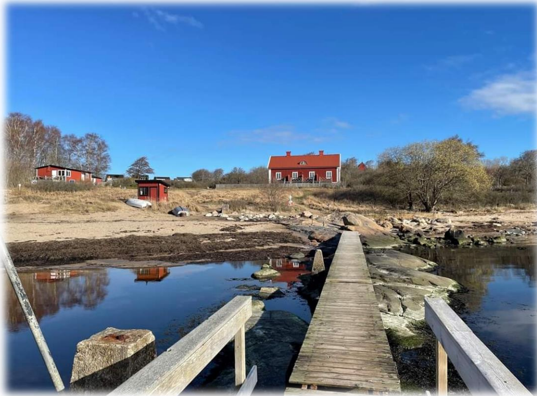
Bild från Tjuvahålan. Viken kallas Tjuvahålan för att den förr varit tillhåll för sjörövare och smuglare.